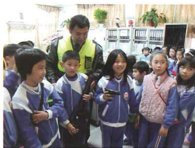
二年級小朋友參觀派出所