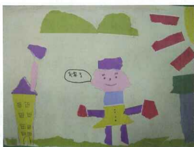
■ 撕貼畫：一忠 黃薇瑄