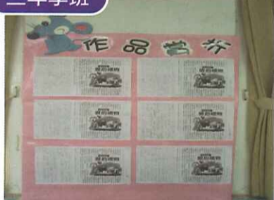
■ 老師精選佳文設計成學習單，並展示學生優良作品