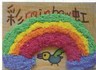
■ 五仁 林雅婷