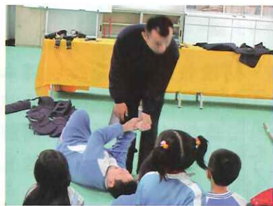
保安隊教官身手讓大家大開眼界