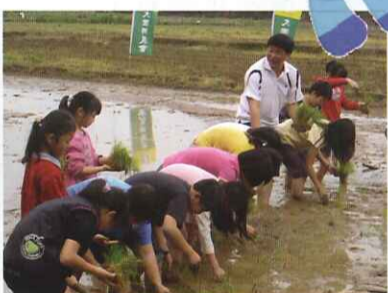
■ 五忠參加四健會插秧活動