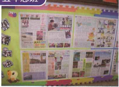
■ 讀報專欄每日更新報紙，學生利用課餘時間閱讀