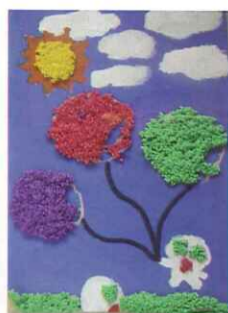
■ 五仁 游蕎甄