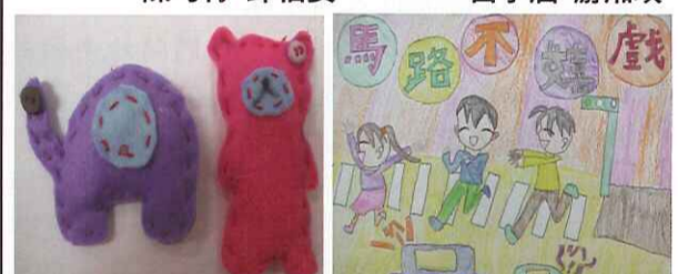
■ 不織布娃娃：四孝 郭驊瑛 ■ 交通安全：四孝 王愉瑄