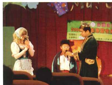
■ 戲劇宣導—談家庭暴力防治