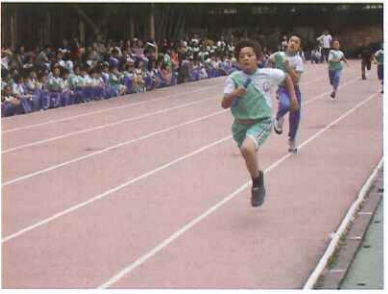
刺激的混齡接力賽