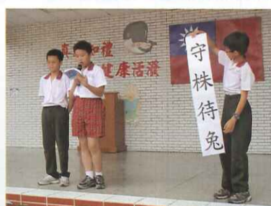
表達力時間及唐詩背誦，讓小朋友有上台發表的機會