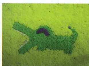
■ 五愛 田家勳