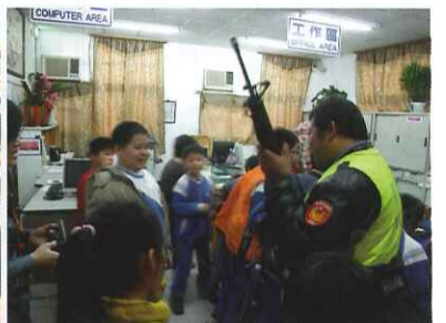
■ 警察叔叔介紹各項警用配備