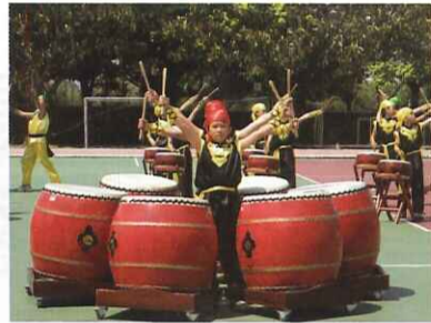
■ 本校「二十四節令鼓」參與桃園縣學校特色認證，師生表現獲得評審委員一致好評！