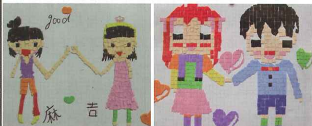
■ 馬賽克拼貼畫：四忠 林鈺婷 郭語暄 陳巧育 邱怡安 ■ 馬賽克拼貼畫：四孝 陳雅婷 游詩婷 呂宇涵 游湘琪

我說：「 彩虹 最愛笑了，不然它怎會變出一張紅、橙、黃、綠、藍、靛、紫的嘴巴大笑呢？」