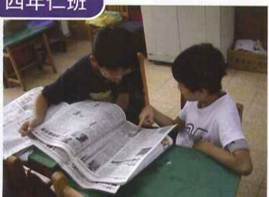
■ 利用閱讀課與綜合課進行讀報教育