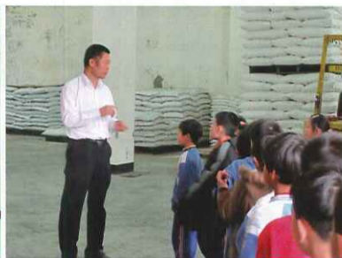
■ 認識農會倉庫中的肥料