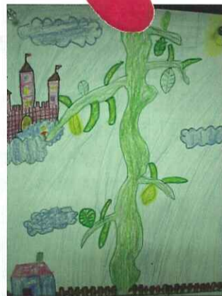
■ 傑克與魔豆：二忠 林子容