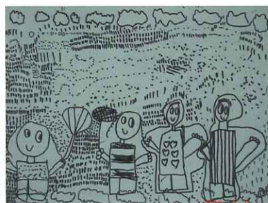
■ 下雨天：一仁 林彩華