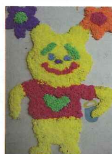
■ 五愛 方知辛