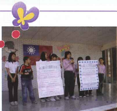
■ 公辦候選人政見發表會