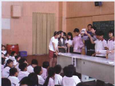
■ 小朋友參與開票、唱票