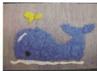
■ 五忠 賴羿玟