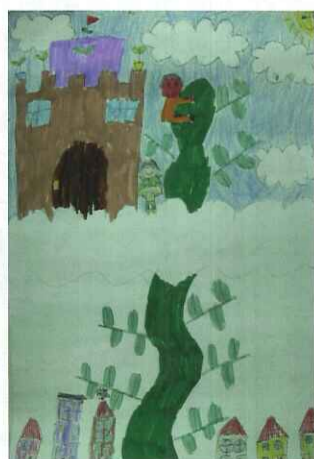
■ 傑克與魔豆：二仁 鄭美寶

恭喜六年級的大哥哥、大姐姐，畢業後希望你們在國一的日子能夠幸福快樂。以前我們一年級的時候有五位大哥哥、大姐姐幫我們打菜，真是謝謝你們，希望你們以後再回來學校看我們。其實我還有一個願望，就是希望大哥哥、大姐姐還能夠再讀埔心國小，那就太棒了！（二仁 吳珮琦）