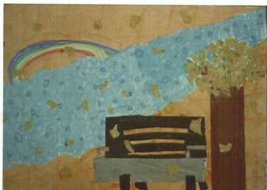
■ 柚木貼畫：三孝 李家蓉