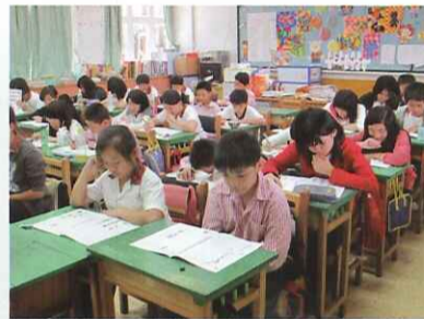
■ 五六年級學生參加基本學力評估