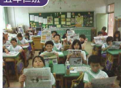
■ 學生讀報後，利用課堂共同討論