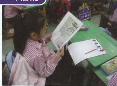
■ 每日簡報閱讀，每週完成簡報塗鴉