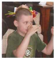
年紀雖小言之有物