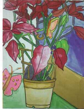
■ 水彩畫：六忠 張雅婷