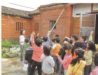
老師向大家介紹三合院