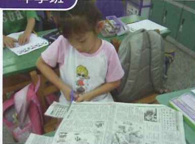
■ 剪下喜愛的文章，寫下最喜歡的句子與塗鴉學習單