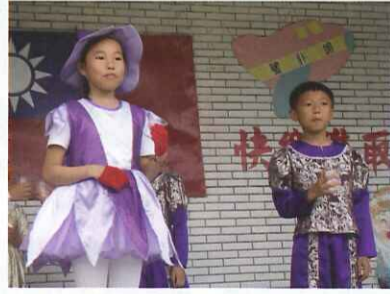
逗趣的英語話劇表演