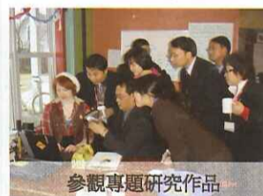
參觀專題研究作品