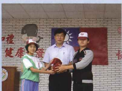
■ 自治鄉長交接典禮