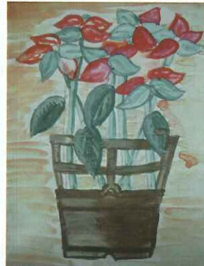
■ 水彩畫：六忠 廖以瑄