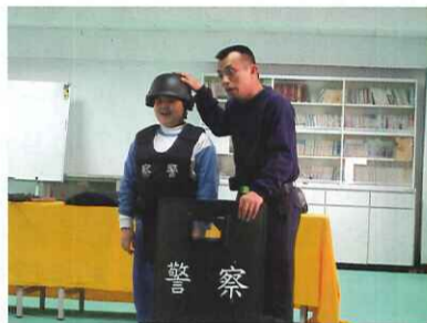
■ 保安隊教練示範鎮暴裝備