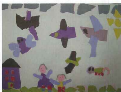
■ 撕貼畫：一忠 胡筱昀