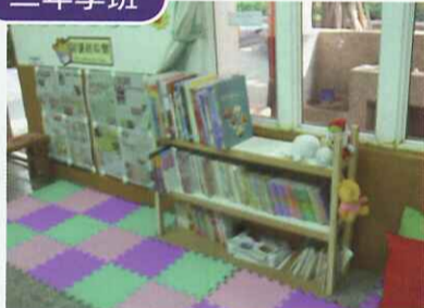
■ 有限的教室空間內布置圖書報紙閱讀角，有溫馨的感覺