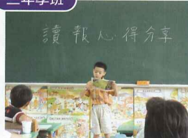
■ 利用晨光時間讀報，並實施讀報心得分享