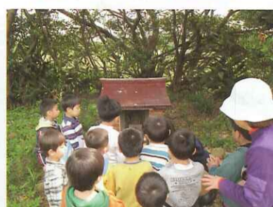
參觀百年土地公廟