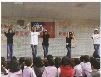
全校慶生會：五年級舞蹈表演，現場氣氛 HIGH 到不行！