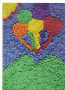
■ 五仁 施懿庭