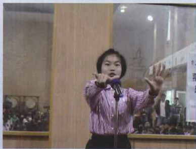
國、臺語演說得獎小朋友於表達力時間重現精采表現，並做檳榔、菸害及視力保健之宣導