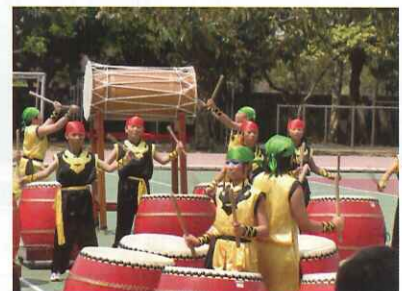
四、五年級大鼓隊有史以來最盛大、精采的演出！