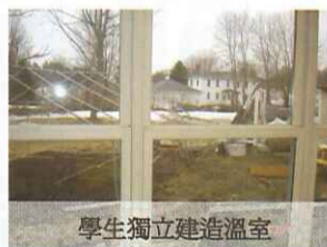
學生獨立建造溫室

教育需要的不是嘉年華式的活動，也不是即興式的創新課程，更不是精美華麗的建築設備堆砌。從The new School 高中校長的身上，更可以感受到那份對教育的愛與熱誠，在校長介紹學校的過程中，總是不斷的稱讚與肯定師生的素質與表現。