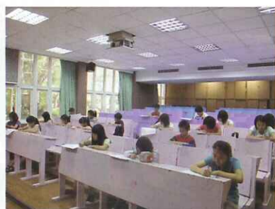
■ 英語金頭腦單字競賽，分初階（各班級內進行）、中階（左圖）、高階（右圖）三階段舉辦，考驗學生英語能力唷！