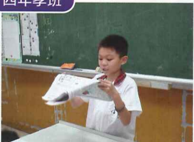
■ 利用彈性時間或配合表達力，指導學生閱讀與朗讀