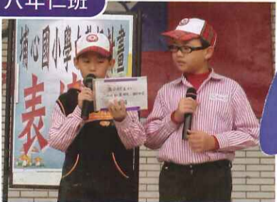
■ 利用學生朝會表達力的時間做佳文朗讀