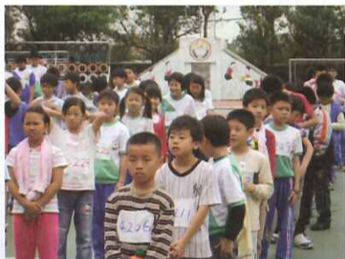
■ 每位小選手都躍躍欲試