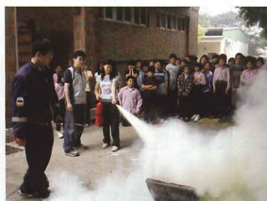
■ 防災教育暨消防演練：滅火器使用、緩降機逃生體驗