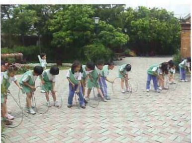
■ 滾鐵圈沒想像中容易耶！