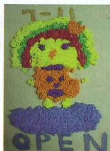
■ 五仁 陳彥廷