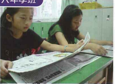
■ 利用彈性課程全班共同閱讀，配合表達力做好文朗讀