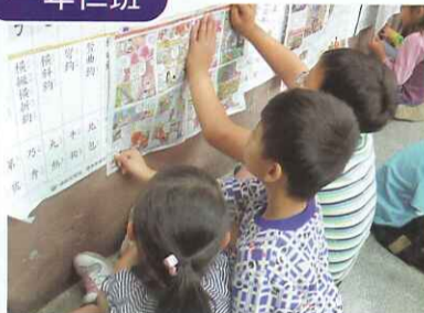
■ 黑板下方布置成讀報區，是小朋友流連的地方