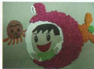
■ 五愛 周銘諺