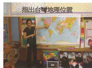
指出台灣地理位置