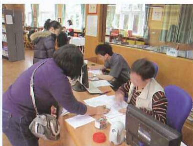
■ 教務處辦理新生報到