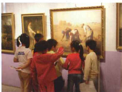
■ 向大師挖寶—參觀米勒展