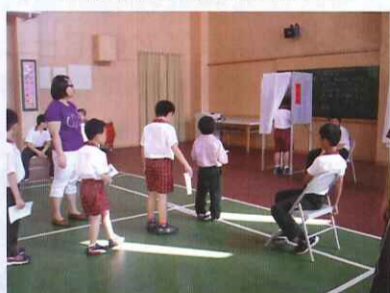
■ 小朋友依序排隊投票