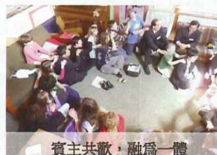
賓主共歡，融為一體