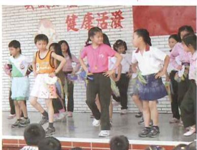
全校慶生會的表演每次都讓人驚豔不已：三、四年級演出