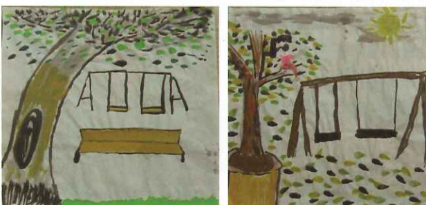
■ 水墨畫：四忠 張亦雯 ■ 水墨畫：四忠 邱怡安