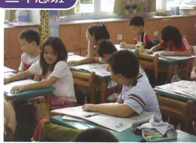
■ 晨光時間大家一起來讀報，與同學分享有趣內容