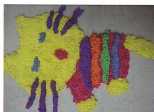
■ 五愛 甘紫嫻