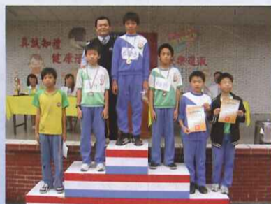
■ 頒獎典禮，大家表現都很棒！