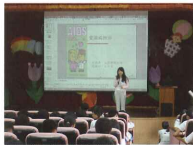
■ 愛滋病與菸害防制宣導