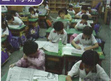
■ 每日報紙均收集起來，利用晨光時間共同閱讀