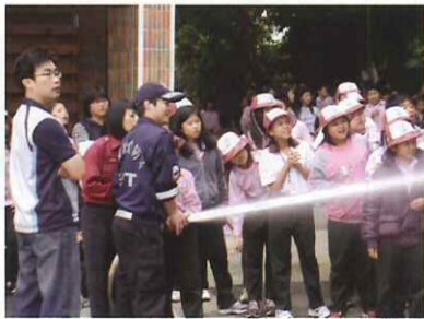
■ 防災教育暨消防演練：消防水柱滅火、火場逃生