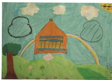
■ 柚木貼畫：三孝 游宜蓓