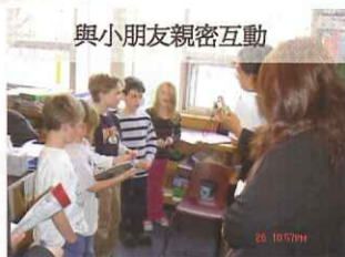
與小朋友親密互動