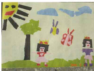
■ 撕貼畫：一仁 吳珮妮