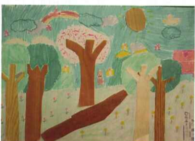
■ 柚木貼畫：三孝 李明芬