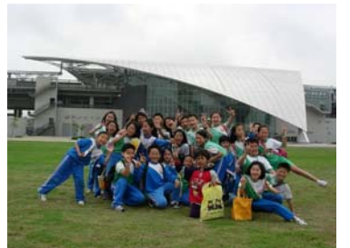
新竹的風好大，我們和屋頂都被吹歪了

「起床！不然就要遲到了！」阿嬤大叫，我睜開惺忪睡眼，心想：「今天阿嬤怎麼這麼早就叫我起床？」走到客廳，瞄了一下日曆，才發現今天是去搭高鐵的日子。唉！我怎麼這麼健忘？