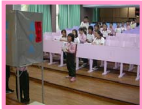
我會遵守秩序排隊投票