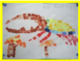
拼貼畫 三忠 龍浩源