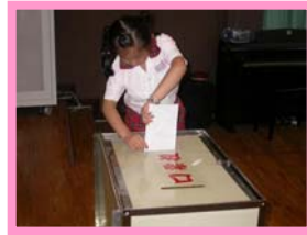
圈選完後投入票箱中