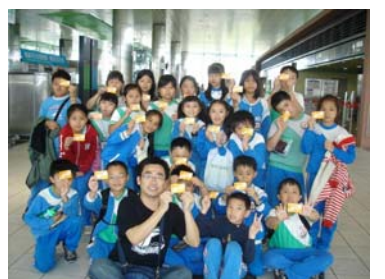
看我的高鐵「樂透」車票