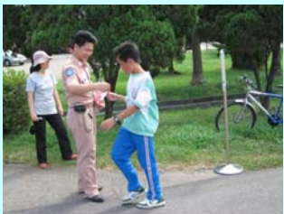
認證點-記得拿認證物喔