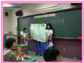
自治鄉候選人到各班政見發表