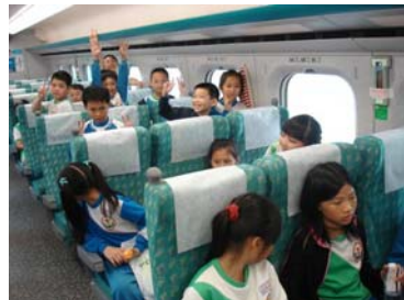
耶！我們的高速之旅要展開囉～