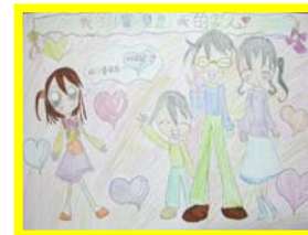
我的寶貝 三孝 王愉瑄