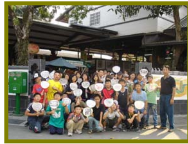
看我們的藝術創作