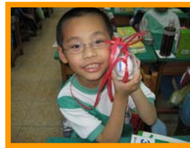
看我的蛋蛋金鐘罩