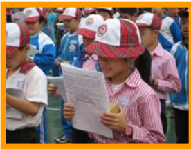
“我會 24 小時蛋不離身”