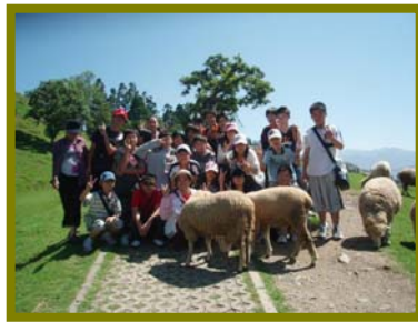
連綿羊都來搶鏡頭耶