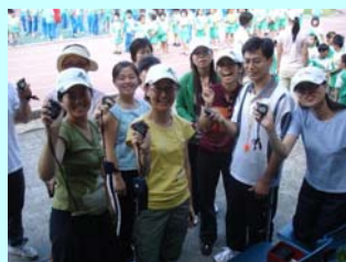
我們是陣容堅強的裁判組