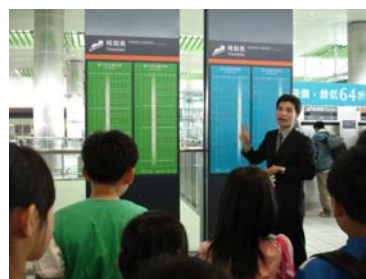
高鐵服務人員為我們介紹搭乘的方式