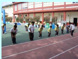
陳康國小共襄盛舉