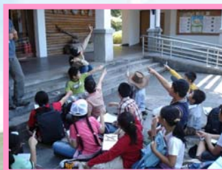
有趣的教學活動寓教於樂