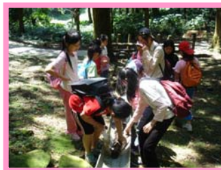
木頭是怎麼搬運的呢？