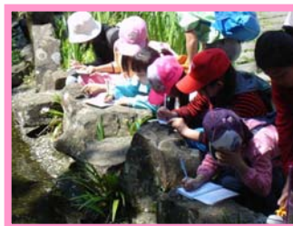
我要把水池裡的生態畫下來