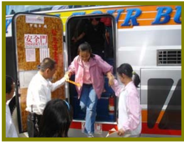
出發前先進行逃生演練