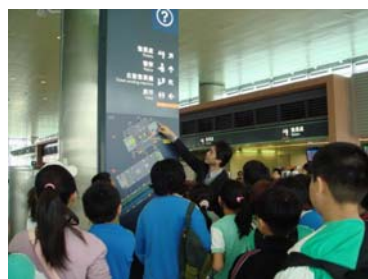
高鐵服務人員為我們介紹高鐵站的設施