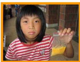
嗚嗚~我的蛋破了~下次再努力