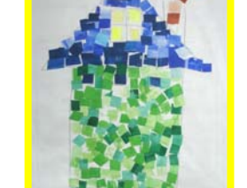
拼貼畫 三忠 鄧惟升