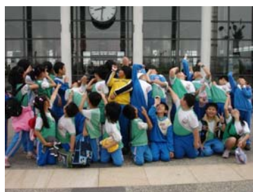
上午八點半，我們抵達青埔站了