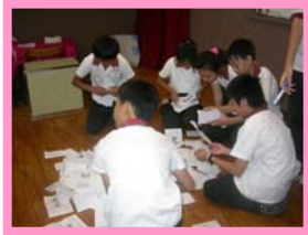
六年級自治鄉幹部進行整票