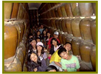
我們快要被酒香醉倒囉