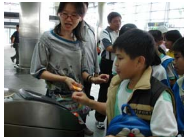
把車票插入自動驗票閘門