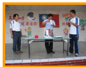
護蛋成功摸彩活動

當開始護蛋時，我小心翼翼的不讓蛋破了，但這也使得我上課有點不專心，下課時間，我去玩不刺激的遊戲——單槓，有一次我從單槓下來時，不小心壓到了，我還以為蛋破了，緊張的打開一看，呼！沒破！害我流了一把冷汗。下一節下課，我不敢再玩遊戲，免得蛋破掉，但是我看到有人玩跳繩時，蛋卻離身了，我很生氣，覺得他們沒有遵守規則。當我把飯吃完後打開盒子，卻發現蛋破了，我很生氣，氣自己為什麼這麼不小心？但是，我看到從蛋殼流出來的蛋黃，想偷嚐嚐生雞蛋的滋味，於是吃了一口，哇！好難吃哦！我下次再也不會偷吃生蛋黃了，因為好噁心！