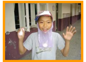
我的蛋已經和我合為一體了

當我把蛋帶到學校時，心情真是既緊張又興奮，過程中發生了一些特別的事，例如：在第二天早上打掃的時候，我的蛋不小心撞到桌角，我打開一看，呼！還好，蛋沒破，我鬆了一口氣。終於到了第三天早上，我還是小心翼翼的保護我的蛋，到了星期五升旗時，皇天不負苦心人，我成功的保護了蛋。