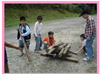
同心協力把木材捆綁起來