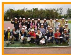
我們都是護蛋成功的好媽媽