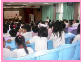
大家一起參與開票過程