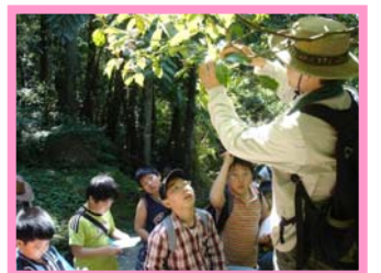
小朋友認真聽著解說員的講解