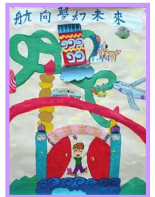
航向飛行未來 四忠 黃金翎、謝承翰、張名凱