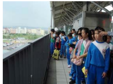
桃園在哪一個方向呢？