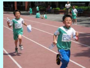
看我的表情有多賣力