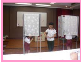
要在規定位置進行圈選喔