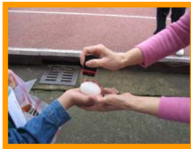
蓋上認證章後，我就是蛋的媽媽了