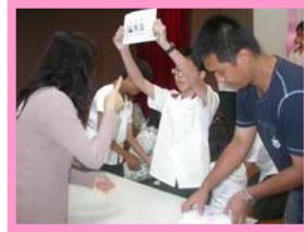
由上一屆小鄉長唱票