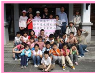
四年愛班的東眼山生態之旅

小朋友在這裡運用聽覺、視覺、嗅覺及觸摸等感官來體會大自然的奧妙，除了認識了森林豐富的生態系，也了解到生物多樣性對於整體環境的重要性，真是一趟快樂又收穫滿滿的知性之旅。