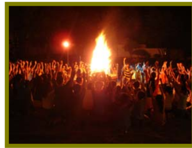
讓我們以營火發誓，永遠記得此時此刻